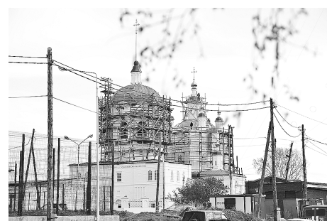
К юбилею Енисейска отреставрируют 21 исторический объект

О грамотном освоении заполярных земель шла речь в СФУ, на стратегической сессии «Север» с участием