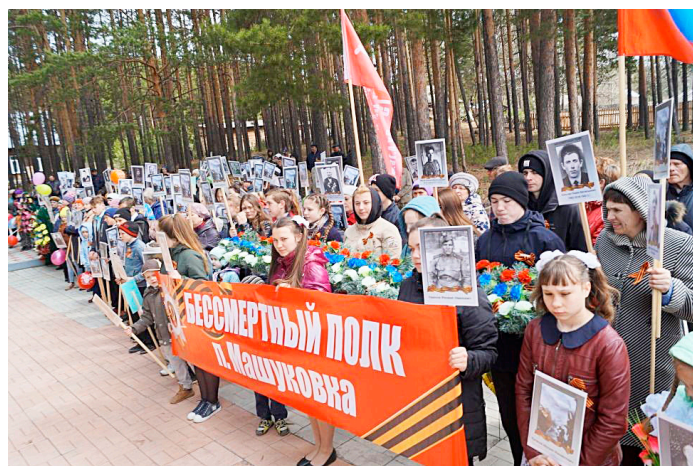
9 мая в Машуковке

В Кулаковской сельской библиотеке была оформлена книжная выставка «Память о войне нам книги оставляют». Для праздничной встречи собрались участники клуба «У Елены». Женщины делились воспоминаниями о своих родных и односельчанах, пели пес-